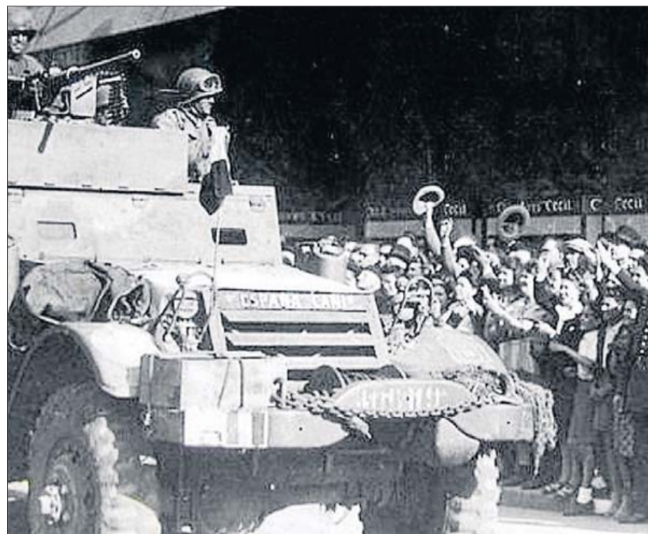
Soldados republicanos españoles entrando en París el día de la liberación. L.O.

Trilles reconoce que «no resulta sencillo aunar personajes reales y de ficción en una novela sobre una etapa histórica tan apasionante como compleja. En el empeño he procurado