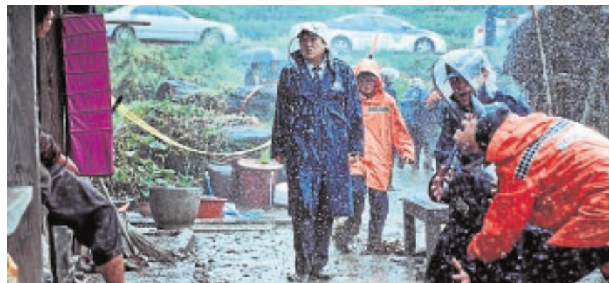
Escena de «El extraño»

► Mercado de Antón Martín. Santa Isabel, 5. 639 12 64 07. Madrid.