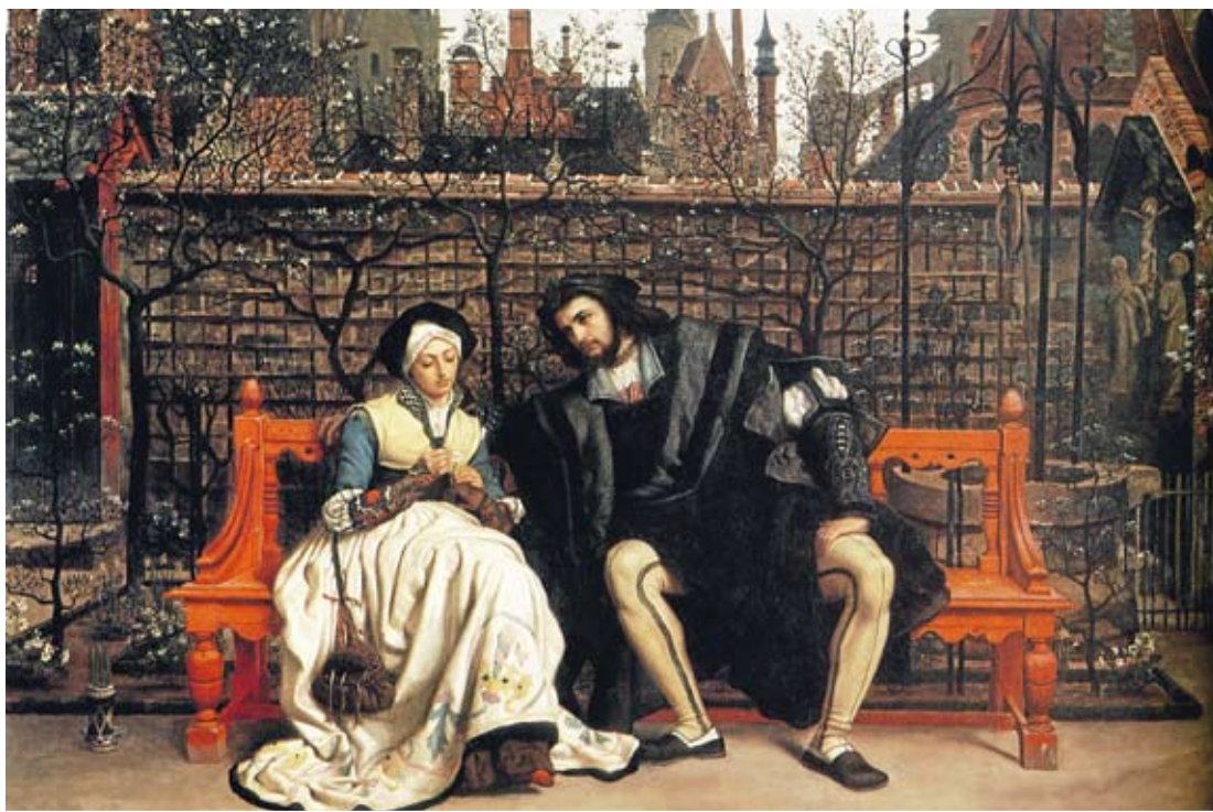
El mito de Fausto, creado por Goethe y recogido en esta obra de Tissot, está presente en 'Los caníbales'. D.P.

La trama se desarrolla en Estambul, cuando aún estaba ocupado por los Aliados en 1918, por lo que esta novela «permite al lector comprender no solo la época en la que hace referencia el libro si no también su propia época», declaró la escritora.